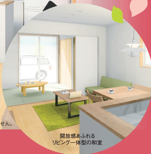
開放感あふれる リビング一体型の和室