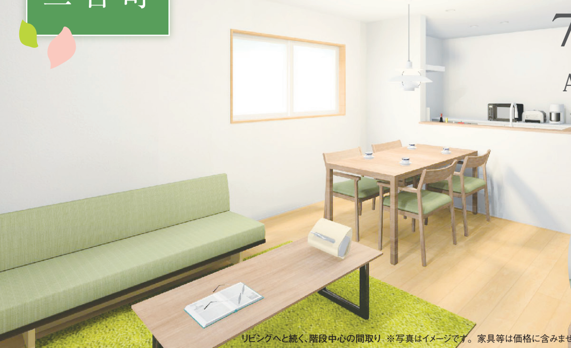
リビングへと続く、階段中心の間取り ※写真はイメージです。家具等は価格に含まません。